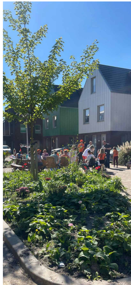
Verbinding tussen burens in Assendelft-Noord

Tekst: Corrie van den Raadt