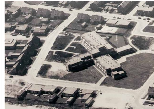
luchtfoto uit 1970