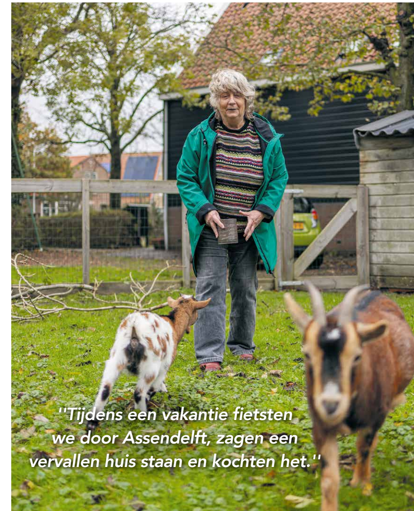
"Tijdens een vakantie fietsten we door Assendelft, zagen een vervallen huis staan en kochten het."