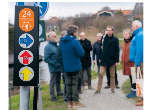
De groep wandelt een stuk mee met de wandelroute maker.