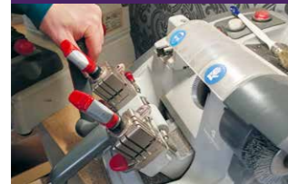
Even sleutels kopiëren voor een klant.