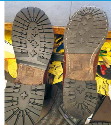
Halverwege de nieuwe zolen en hakken.