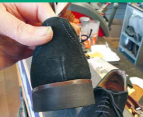
Met dit nieuwe onderwerk gaan deze herenschoenen weer lang mee.