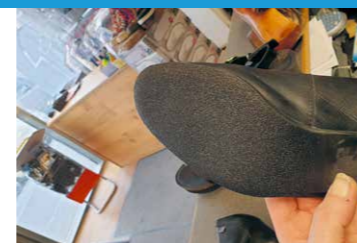
15.00 uur Het eindresultaat.