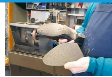
Damesschoenen die wel een nieuw zooltje kunnen gebruiken