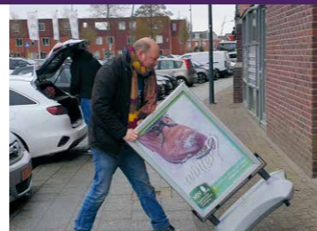
Het bord kan weer naar binnen Ik kan de hele dag wel werken, maar toch sluit ik nu maar af. Morgen weer een dag :-).