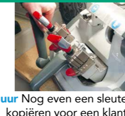
17.10 uur Nog even een sleutel kopiëren voor een klant.