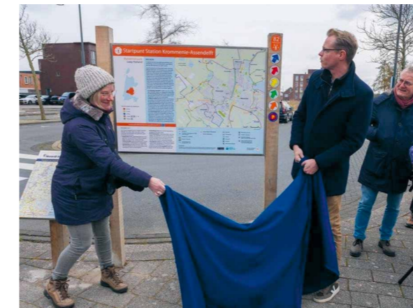
De onthulling van het bord bij het station.

Op 30 januari is bij de Admiraal in Assendelft een bijeenkomst geweest over MAAK Noord. Tijdens deze bijeenkomst is het werkboek MAAK NOORD geïntroduceerd. Bewoners worden meegenomen in allerlei projecten via het werkboek. Check de site: https://maaknoord.zaanstad.nl/