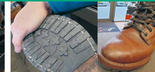
Deze stoere herenschoenen zijn van boven nog prima maar hebben een nieuw onderstel nodig.