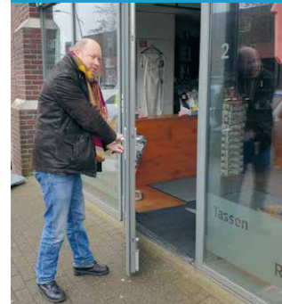
Deze Maartse dag begint met sneeuwruimen.