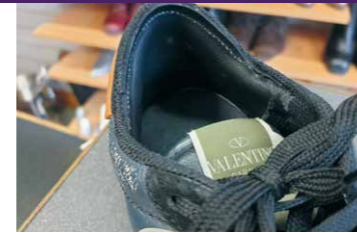
13.05 uur Deze gymbies krijgen een nieuwe hielvoering.