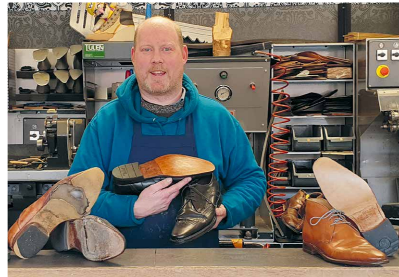
Dit zijn een paar Van Bommel nobel blue, ik schat zo'n 15 jaar oud, weer als nieuw hersteld!

Als Meester Schoenmaker word ik elk jaar gekeurd om de kwaliteit van mijn ambacht te waarborgen. Daardoor mag ik bijvoorbeeld schoenen van merken zoals Van Bommel repareren. Ik ben ook actief binnen de winkeliersvereniging en ondersteun daar graag nieuwe initiatieven zoals Het Sociale Winkeltje.