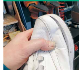
Een losse sneakerzool vraagt om lijm.