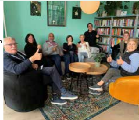
Medewerkers zijn blij met de gesponsorde nieuwe zithoek.