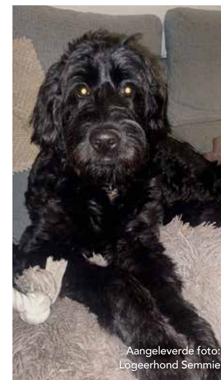
Logeershond Semmie