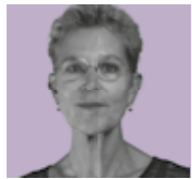
Gré Noom REDACTIE & ORGANISATIE