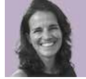
Linda van Amerongen VORMGEVING