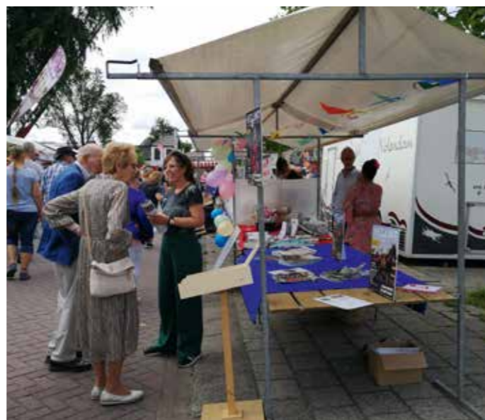
Gezelligheid op de braderie

We zijn de zomer goed begonnen met de midzomerbraderie op de Dorpsstraat. Het Lint stond er ook en wat was het leuk! We vonden het fantastisch om met zoveel Assendelvers kennis te maken.