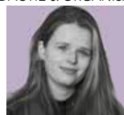
Joyce Schouten FOTOGRAFIE