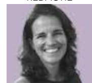
Linda van Amerongen VORMGEVING