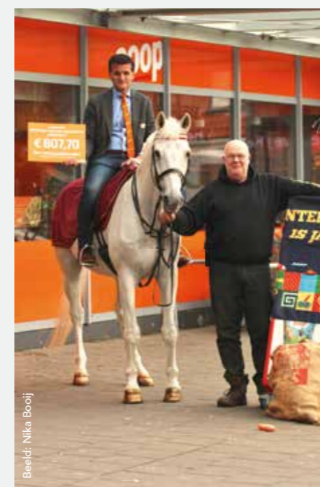
Beeld: Nika Booij