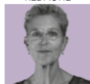
Gré Noom REDACTIE & ORGANISATIE