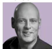
Erwin van Doleweerd ADMINISTRATIE