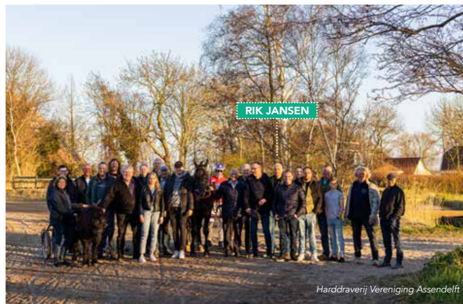
Harddraverij Vereniging Assendelft