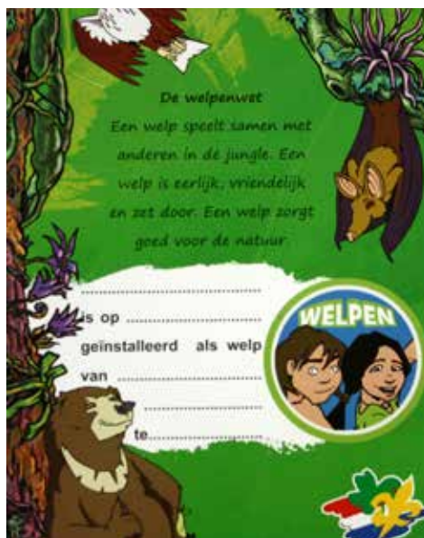
Welpen-Diploma uit 2019

Als je denkt dat je scouting leuk zou vinden, kan je eerst een paar keer gratis komen kijken, je wilt natuurlijk eerst weten of je het echt wel leuk vindt. Wie lid wordt van Scouting gaat een soort uniform dragen. Dan koop je een 'lege' trui, T-shirt met 'da's pas leven!' erop en een das. Op die kale trui horen verschillende badges met allemaal hun eigen betekenis. Het is niet zo dat je die badges zomaar krijgt. Die kan je pas na het installeren gaan verdienen. Installeren is één van de tradities van Scouting. Een ceremonie waarmee een nieuw lid een belofte aflegt die bij jouw leeftijdsgroep hoort. Je zegt dan dat je je gaat houden aan de wet van jouw leeftijdsgroep. Die wet is voor de Welpen: 'Een Welp speelt samen met anderen in de jungle. Een Welp is eerlijk,