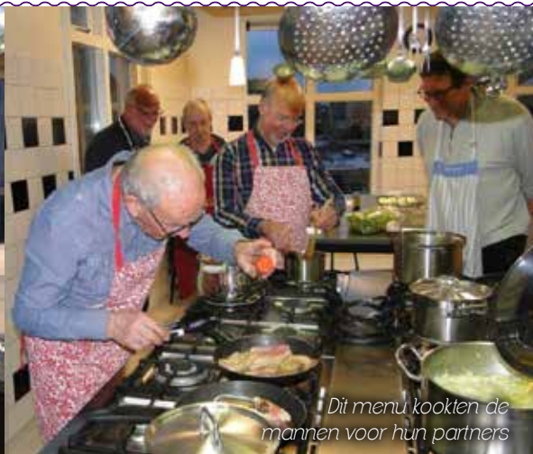
Dit menu kookten de mannen voor hun partners