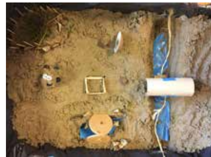
Een vlot, een moestuin en een bos.