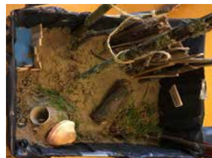
Een heuvel met een glijbaan, een vijver, een boomhut, veel takken en gras.

De Gezonde Buurt houdt niet op bij meer groen en speelaanleidingen in de wijk. De bewoners hebben namelijk ook hun liefde voor culturen en lekker eten gevat in een plan om met elkaar een wereldbarbecue in de zomer te organiseren. Daarnaast zal de trimroute aan de oostkant van de wijk worden uitgebreid naar dit deel van Saendelft. Zo zijn er tal van initiatieven en ideeën die Saendelft-West tot een fantastisch voorbeeld van een Gezonde Buurt maken: een groene buurt waar kinderen lekker buiten kunnen spelen, bewoners elkaar kennen en er tal van activiteiten zijn om dit in stand te houden. Daarnaast zal de trimroute die op 8 mei geopend wordt aan de oostkant van de wijk, worden uitgebreid enz.