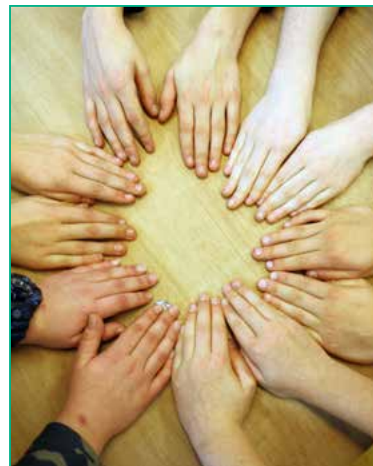
Gouden handen van de Klusklas

Voor deze achtste editie van Het Lint heeft de redactie als thema gekozen: Gouden handen in Assendelft. Als we door Assendelft rijden zien we zoveel ondernemers die dankzij hun vaardige handen mooie bedrijven tot stand hebben