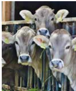
Koeien (maar dat zag u zelf al)