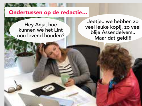
Ondertussen op de redactie...