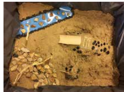
Een klimheuvel met een glijbaan en een vijver omringt door stenen.