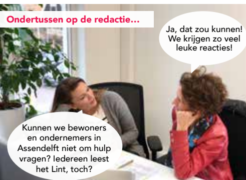
Ondertussen op de redactie...

De tuinen zijn 170m 2 tot 255m 2 groot en de prijzen variëren tussen de € 35,- en de € 75,- per jaar. Ook is het mogelijk om te starten met een halve tuin om jezelf de tijd te geven om het tuinen te leren. Tuinieren is gezond en vergt tijd en inzet. Spreekt dit je aan? Dan is tuinen echt iets voor jou. Als jij deze unieke kans niet wilt missen, neem dan contact op met werkmanskracht@hotmail.com om de tuinen vrijblijvend te bekijken welke vrij zijn voor het aankomende seizoen. Wacht niet te lang! Weg is weg!