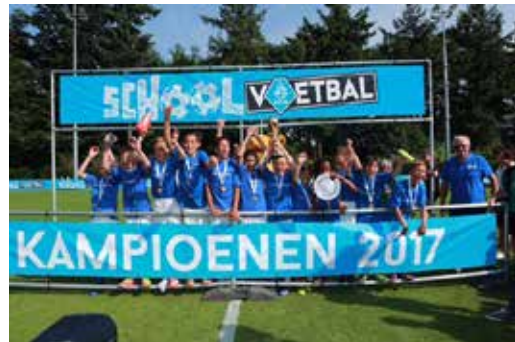
Afgelopen schooljaar is het team van De Meander Nederlands schoolvoetbalkampioen geworden!

Aan elke leerling wordt naar zijn talent gevraagd: wat vind je leuk, waar ben je goed in en hoe wil je er op school aan werken? Door de stimulans en de ruimte voor ontwikkeling zie je talenten opbloeien. En voor kinderen op topniveau is er goed leerlichtbeleid afgesproken. Kinderen krijgen ook les in gezonde leefstijl en er wordt fruit gegeten en water gedronken. Want wie goed wil presteren moet goed eten.