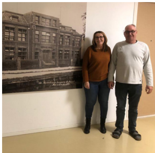
Langs de Dorpsstraat (pag. 4-5)