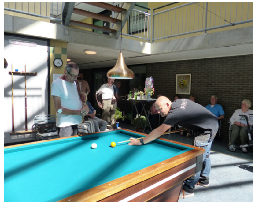
De nieuwe biljarttafel wordt volop gebruikt