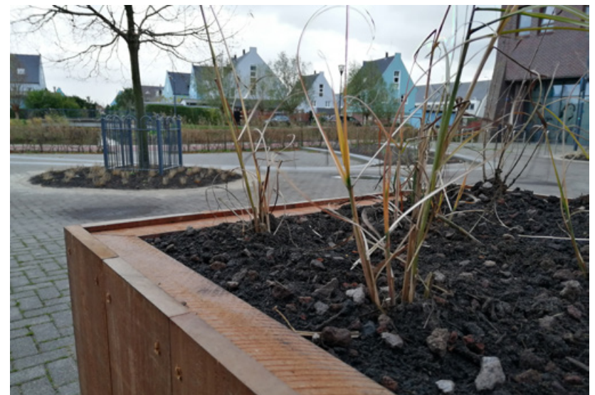
Het winkelcentrum wordt groener

De eigenaar van winkelcentrum De Saen heeft in overleg met bewoners, winkeliers en gemeente een groenplan gemaakt. De wens bestaat al wat langere tijd om het winkelcentrum te vergroenen. De werkzaamheden zijn in volle gang en zijn afgerond voor het einde van 2021.