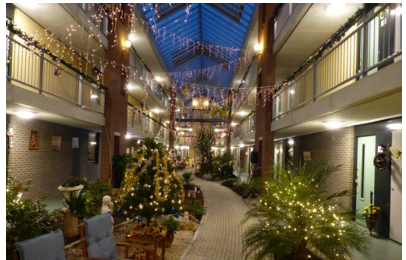
De binnentuin: sfeervol versierd in de decembermaand

Afgelopen zomer is de prachtige binnentuin verrijkt met een biljarttafel. Een bewoner (die niet met naam genoemd wil worden) heeft hem geschenken en de tafel is 8 juli officieel in gebruik genomen. Tijdens de decembermaand versieren de bewoners de tuin helemaal zelf en het resultaat is iets waar ze trots op mogen zijn: de tuin is dan een lust voor het oog. 'Het hele jaar rond is het fijn wonen in De Vlinder. Als er al een woning vrijkomt, is daar altijd veel belangstelling voor', aldus Elly en Suus.