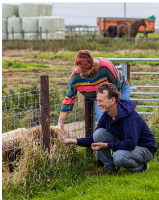
Zorg en liefde bij het Thomashuis (pag. 3)