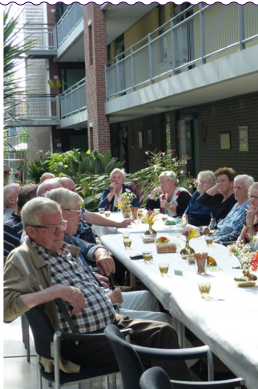
Samen leven in De Vlinder (pag. 16)