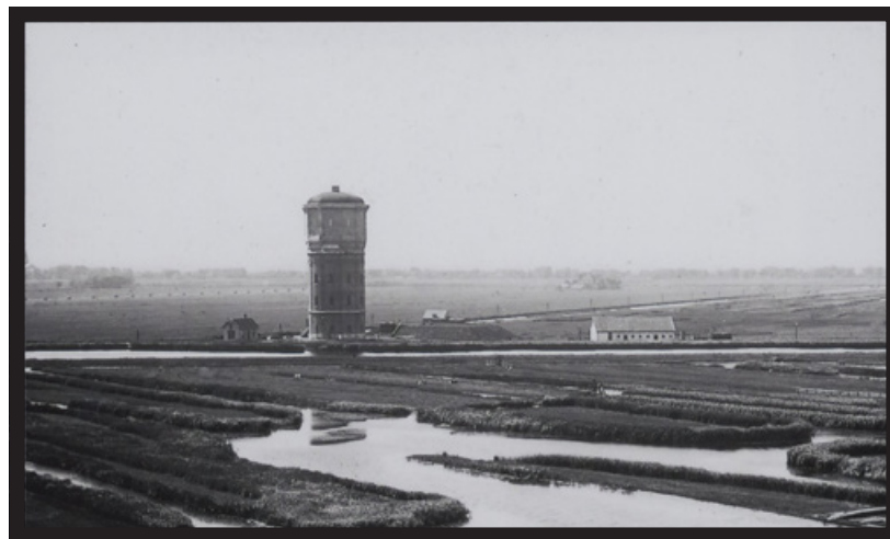
Watertoren vanaf de Communicatieweg Oost 12 tussen 1920 en 1950

Volg @hetlintassendelft voor alle updates over het leukste blad van en voor Assendelft.