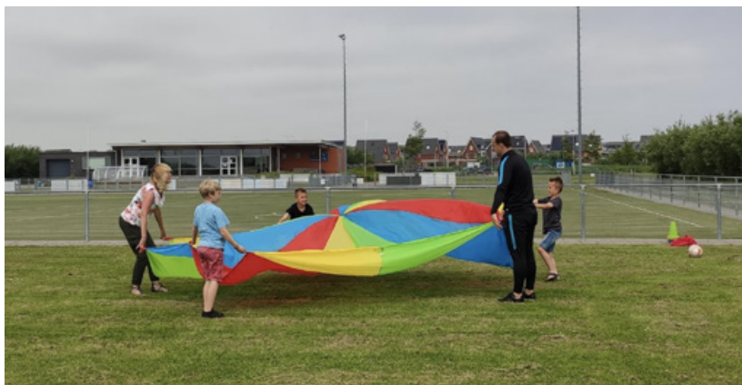
Spelende kinderen bij Babino Olympia

Door Annemieke Schoen. De nieuwe locatie van Babino BSO Olympia (gebaseerd op de olympiër Jaap Boot) in Saendelft is actief op het groene gras. Als ik dwaal langs het sportcomplex aan de Overtoom vind ik een korfbalveld dat fantastisch onderhouden blijkt te zijn. Klaar voor een actieve naschoolse opvang en sportende kinderen uit Saendelft.