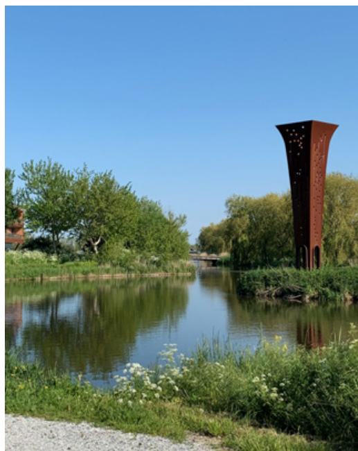
Tweede plaats - Monique Mooren