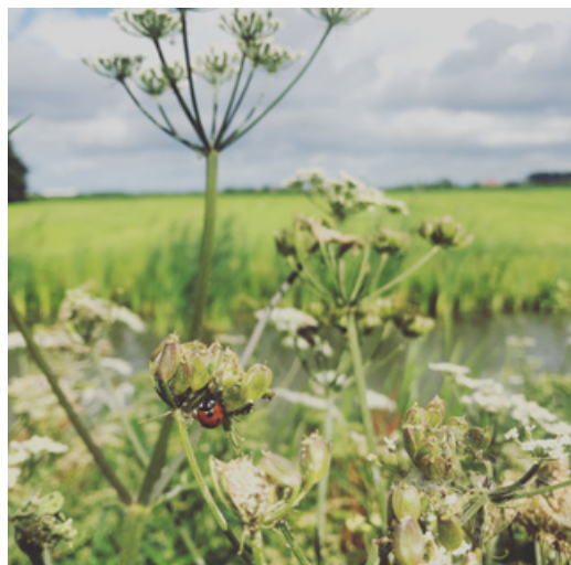
Derde plaats - Agnes Bakkum