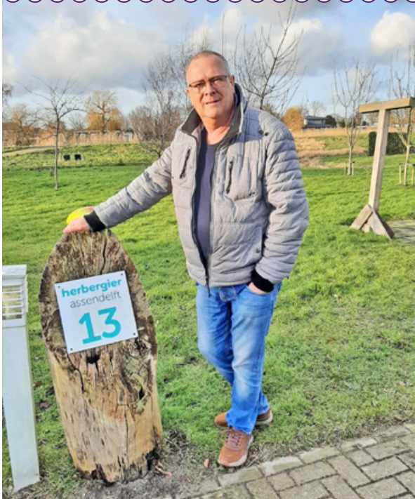
Fred Ceelie van 'De Herbergier'