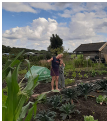
Fotografie: Agnes Bakkum en Isa