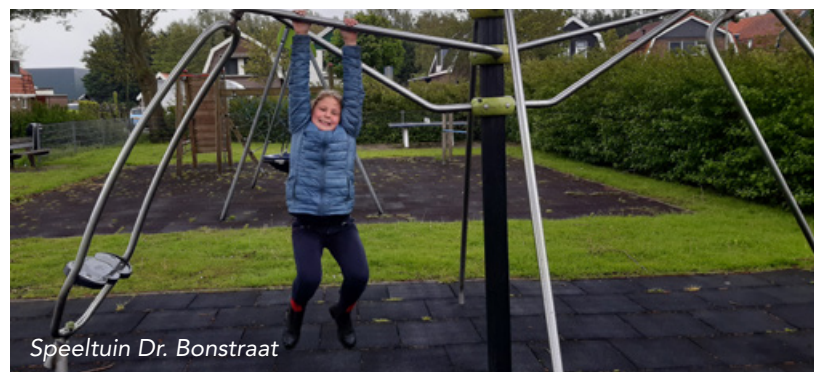
Speeltuín Dr. Bonstraat

Op buitengewoon.zaanstad.nl staat te lezen dat de speelplek aan het Schaakbord in Kreekrijk eind september 2021 wordt aangelegd. Iedereen kon leuke ideeën, tekeningen, foto's of plaatjes van mooie speelplekken en/of speeltoestellen opsturen. Al die ideeën en wensen zijn bekeken en verwerkt in twee ontwerpen. Deze zijn vanaf 7 juli te zien op de website, waar je dan kan laten weten welk ontwerp jij kiest (buitengewoon.zaanstad.nl/projecten/speelplaats-kreekrijk).