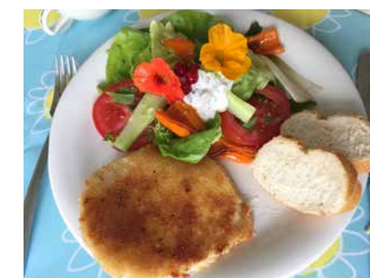
Smullen van lokale producten [Foto redactie Het Lint]

“Mijn boodschap voor alle culturen is: zoek het lekker lokaal”